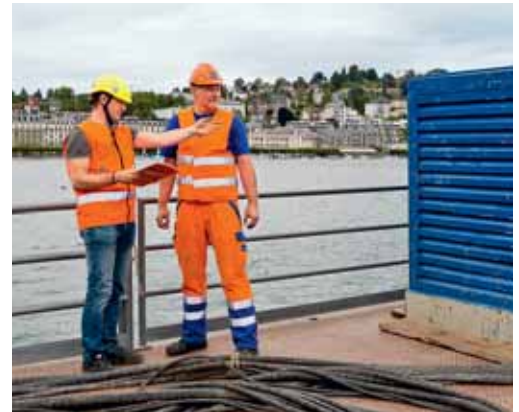
Bild 1: Das Arbeiten am, im oder über Wasser erfordert vertieftes Fachwissen und eine systematische Koordination der Sicherheitsmassnahmen.