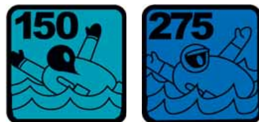
Bild 6: Rettungswesten sollten einen Auftrieb von mindestens 150 N aufweisen (EN ISO 12402-3/-2).