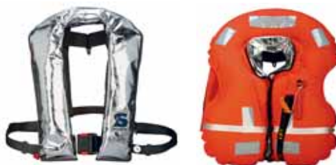
Bild 7: Beschichtete Hüllen schützen das Gewebe der Rettungsweste vor Funken und Schweissperlen oder vor grosser Hitze. Die Herstellerangaben sind zu beachten.