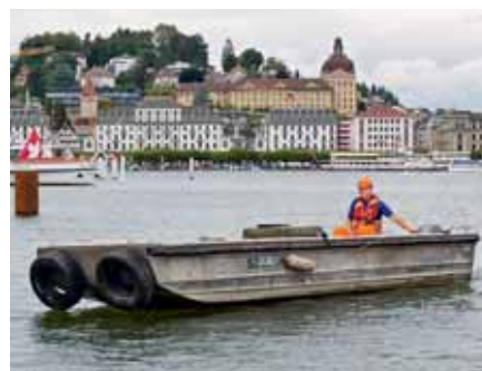
Bild 8: Die eingesetzten Schiffe oder Boote, deren Ausrüstung und die Ausbildung der Schiffsführer müssen den Bestimmungen der Binnenschiff-fahrtsverordnung entsprechen. Bei Übersetzfahrten müssen Rettungswesten getragen werden.

In schiffbaren fliessenden Gewässern sind Rettungsboote mit Motorantrieb zu verwenden. Die Antriebsschrauben sind mit Schutzkorb/-bügel abzudecken. Bei Motorbooten mit einer Antriebsleistung von mehr als 6 Kilowatt muss der Schiffsführer über einen gültigen Führerausweis verfügen!