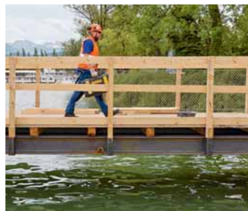
Bild 5: Massnahmen gegen Stürze ins Wasser sind unabhängig von der Absturzhöhe zu treffen.