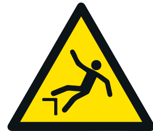
Bild 2: An Gewässern ist der Sturz ins Wasser mit technischen Massnahmen zu verhindern. Diese kollektiven Schutzmassnahmen (z. B. Seitenschutz, Gerüste) sind im Werkvertrag zu regeln.