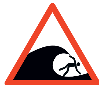
Bild 3: Gefahren durch und für Dritte (z. B. Kraftwerkbetriebe) müssen ermittelt werden.