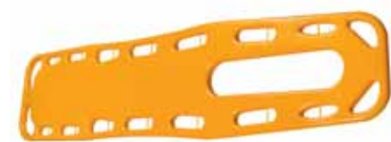
Bild 9: Das Spineboard ist ein geeignetes Hilfsmittel zur Bergung von Personen im und aus dem Wasser.

18. Werden geeignete Massnahmen getroffen, um eine Unterkühlung von Personen im Wasser zu verhindern ?