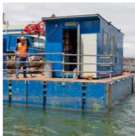
Bild 10: Auch auf Plattformen, Pontons, Flossen usw. ist wasserseitig ein Seitenschutz anzubringen.

Siehe Factsheet «Seitenschutz»: www.suva.ch/waswo/33017.d .